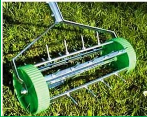
دستگاه ساده تهویه چمن